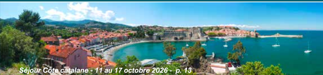
Séjour Côte catalane - 11 au 17 octobre 2026 - p. 13