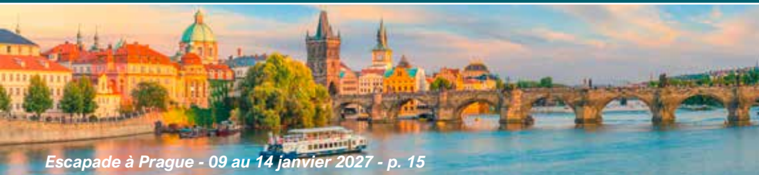
Escapade à Prague - 09 au 14 janvier 2027 - p. 15